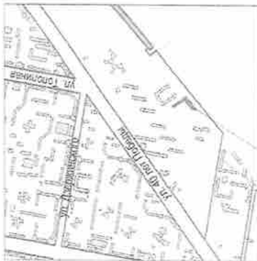
Местоположение земельного участка